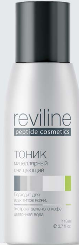
REVILINE® Тоник мицеллярный очищающий