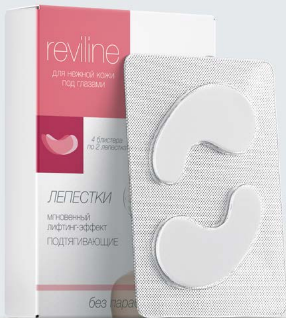
REVILINE® Лепестки подтягивающие