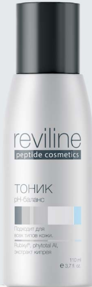
REVILINE® Тоник pH-баланс