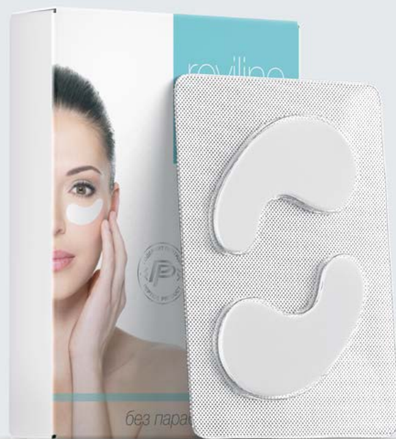
REVILINE® Лепестки от отеков и темных кругов под глазами